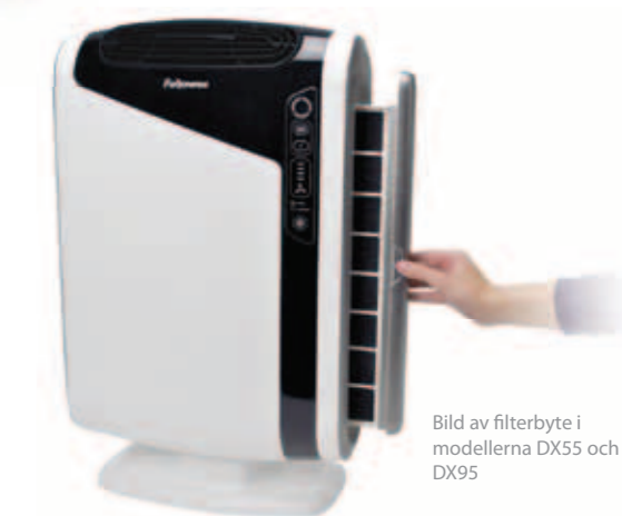
Bild av filterbyte i modellerna DX55 och DX95