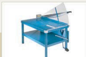
Nedfällt - sidobord