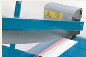
Tillbehör: 100797 Lasermodul